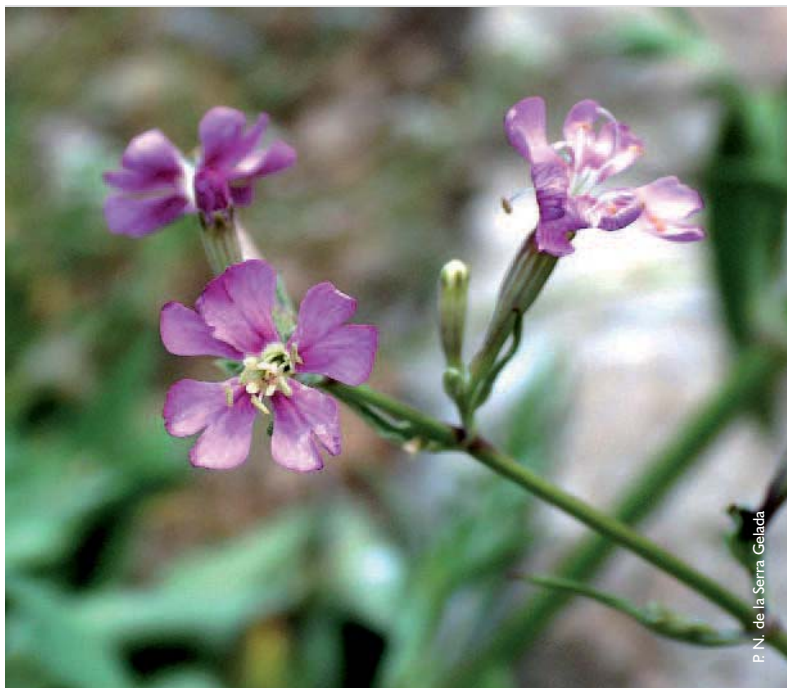
Silene d'lfac ( Silene hifacensis )

els botànics denominen rupícoles i entre aquestes trobem la silene d'lfach ( Silene hifacensis ), que actualment s'està recuperant en l'àmbit del parc, l'orella de ratolí ( Sarcocapnos saetabensis ) o la canyeta d'or ( Asperula paui subsp. dianensis ).