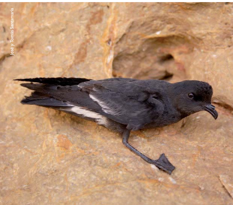
L'escateret ( Hydrobates pelagicus melitensis )

De la fauna terrestre, destaquen el grup de les aus marines, perquè tenen en el parc importants zones de cria. L'escateret ( Hydrobates pelagicus melitensis ) que nidifiquen en l'illa Mitjana i en la de Benidorm, té en aquesta última, una de les colònies de reproducció més gran del mediterrani occidental, amb més de 500 parelles.