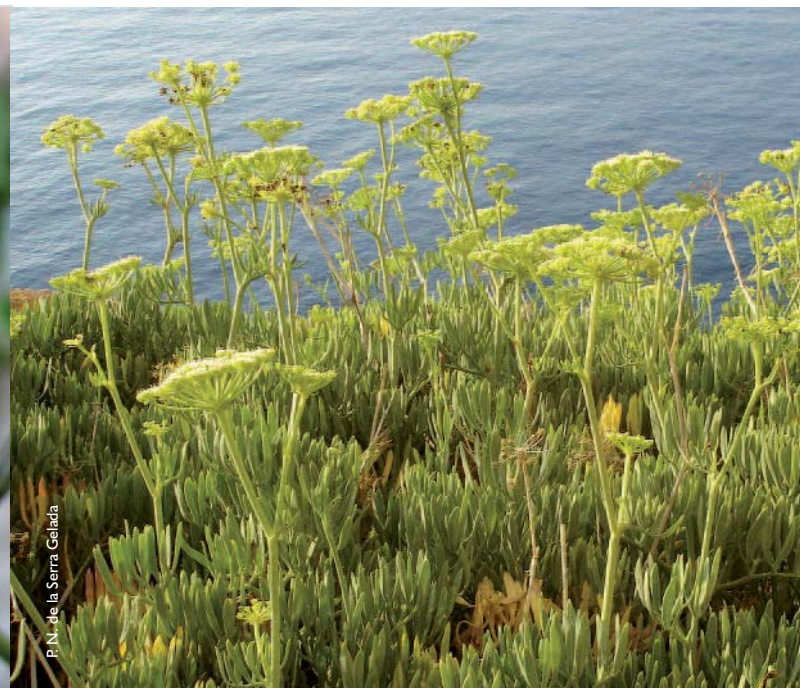
Fenoll marí ( Crithmum maritimum )

En la major part de la serra Gelada podem observar matoll compost principalment per romer ( Rosmarinus officinalis ), bruc d'hivern ( Erica multiflora ), càdec ( Juniperus oxycedrus ) i espart ( Stipa tenacissima ) acompanyats sovint per pi blanc ( Pinus halepensis ) i alguns exemplars de carrasca ( Quercus rotundifolia ) d'escàs port. Hi ha també vestigis de vells cultius, on s'aprecien exemplars dispersos de garrofera ( Ceratonia siliqua ) i olivera ( Olea europaea ). Aquests bancals abandonats han sigut colonitzats, entre altres espècies, per coscolls