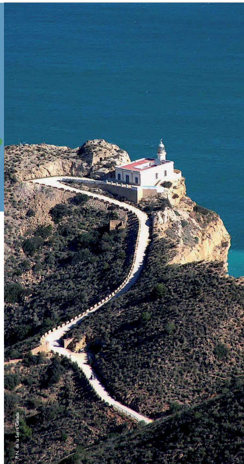
P.N. de la Sarra Gelada